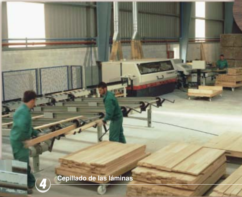
4 Cepillado de las láminas