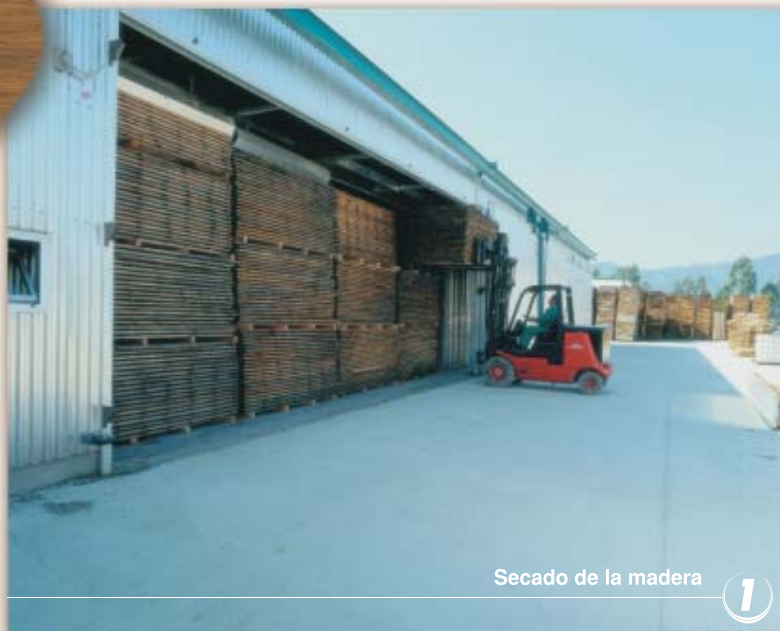
Secado de la madera

Las propiedades mecánicas de la madera Globúlus se revelan excepcionales y superiores a los valores estándar de frondosas europeas como el roble o el haya.