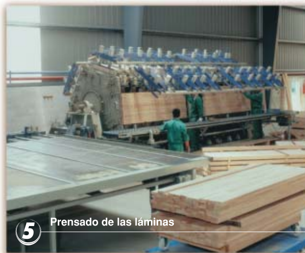
5 Prensado de las láminas