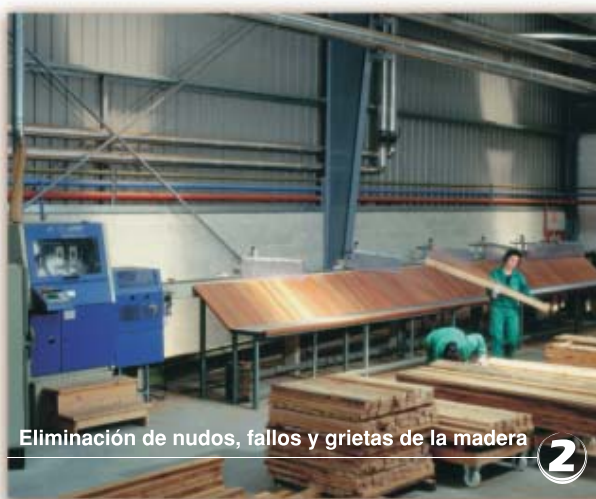
Eliminación de nudos, fallos y grietas de la madera