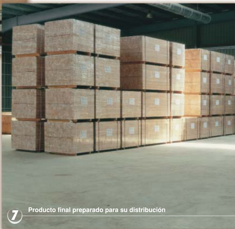
7 Producto final preparado para su distribución

El auge del empleo de perfiles de madera laminada en la carpintería y, en concreto, en la fabricación de ventanas se inicia en el año 1982. Las ventajas de este producto son las siguientes: