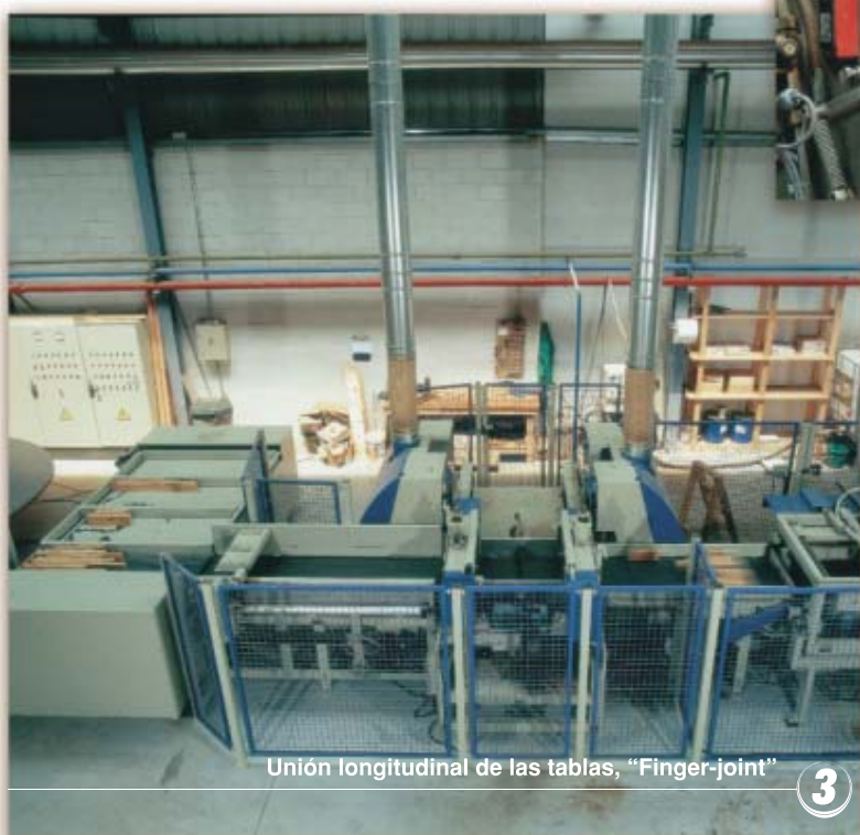
Unión longitudinal de las tablas, "Finger-joint"